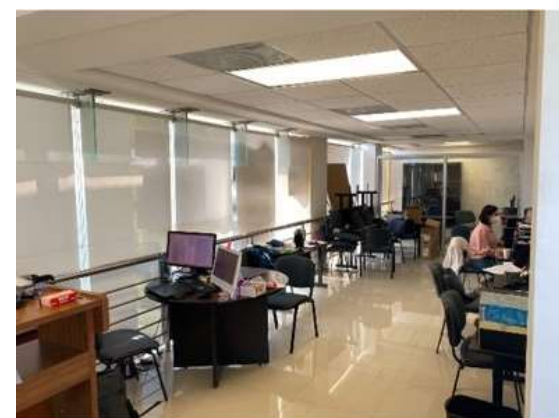
Sala de lectura

En la aulas de posgrado se llevan a cabo las clases de los diferentes módulos educativos de las maestrías que se ofertan en la Facultad de Medicina y la sala de lectura es un espacio para que los maestrantes puedan estudiar y trabajar en sus proyectos de investigación.