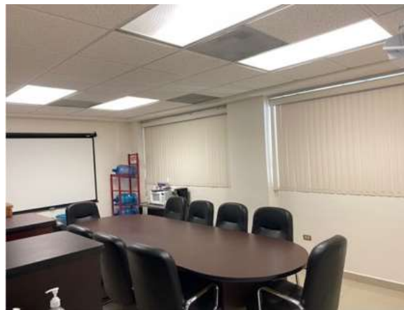
Sala de juntas

La Maestría en Docencia en Ciencias de la Salud tiene sus oficinas en el segundo piso del edificio de posgrado de la Facultad de Medicina, en la recepción y coordinación se llevan a cabo los procesos administrativos para que se desarrollen las actividades propias de la maestría, se hacen las gestiones académicas y administrativas que requiere el posgrado para que se desarrollen las actividades del programa educativo que van desde la realización y emisión de convocatorias hasta el egreso del maestrante así como la atención al alumno, docente y al público en general. En la sala de juntas, el núcleo académico se reúne con regularidad para la toma de decisiones de logística del programa.