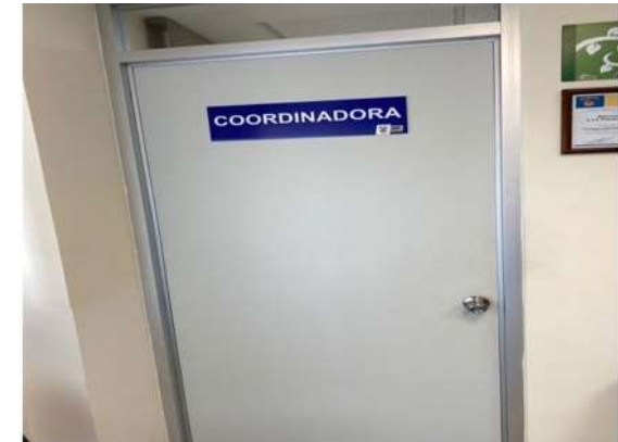
Entrada a la Coordinación