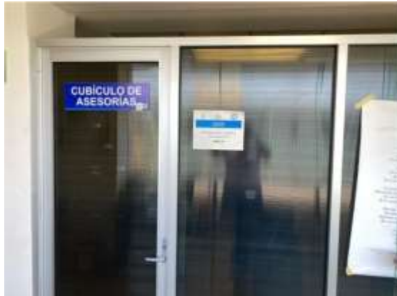
Cubículos de asesoría