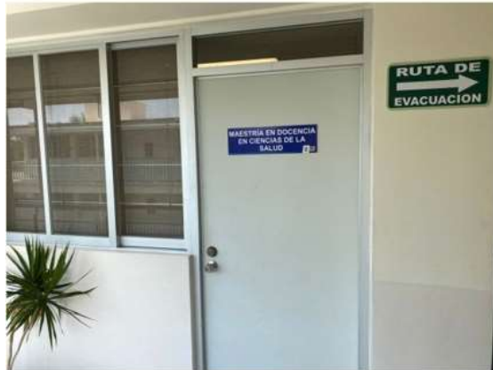
Puerta de entrada a las oficinas de la Maestría en Docencia en Ciencias de la Salud (MDCS)